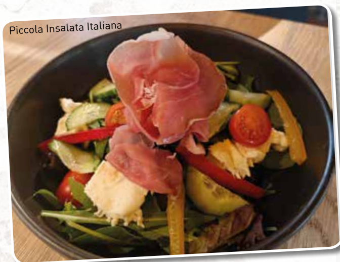
Piccola Insalata Italiana