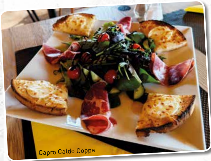
Capro Caldo Coppa