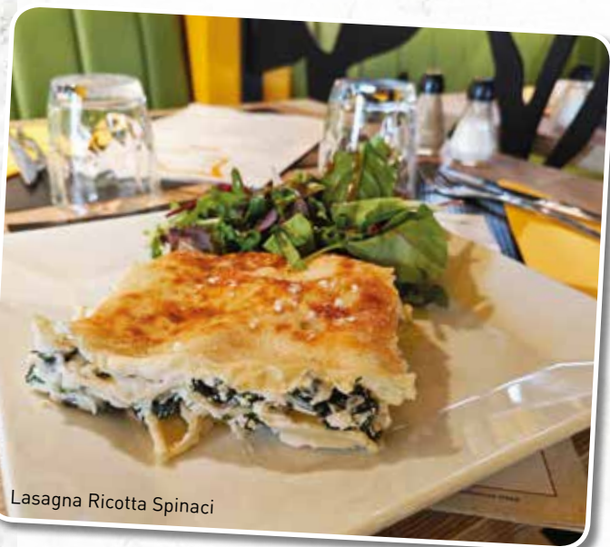
Lasagna Ricotta Spinaci