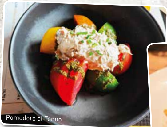
Pomodoro al Tonno

UN MENU ENFANT OFFERT POUR UN PLAT DE LA CARTE ACHETÉ LE MERCREDI ET LE SAMEDI.