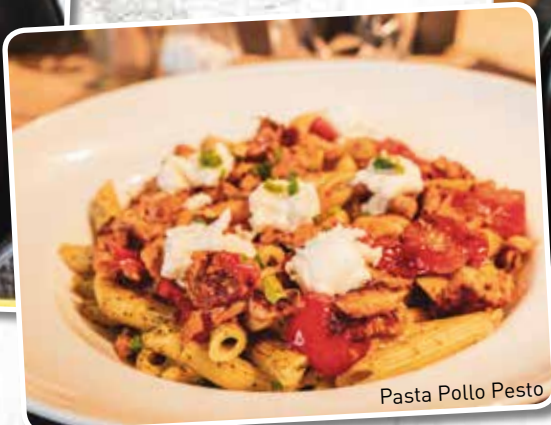
Pasta Pollo Pesto